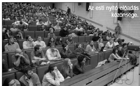
Az esti nyitó előadás közönsége.

„A hétfő a való világ már. De többször vettem azon észre magam, hogy munka közben az ÉS Napok mottóénekeit dúdoló, néha énekelem is, és hogy gondolataim néha a floorball, néha a röpi körül járnak, aztán eszembe jut a SZTÁR, aki