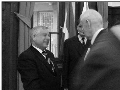
Szilvási testvér fogadja a jelenlévők gratulációját.