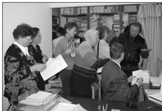
A résztvevők örömmel éltek az akciós könyvvásár nyújtotta lehetőséggel.

Forgalmazunk más uniók kiadói által megjelentetett könyveket is, ha bárkinek igénye, kérdése van ezen a téren, szívesen segítünk! Ezúton kérünk minden kedves testvért, hogy ha más országból kívánnak könyveket rendelni, feltétlenül vegyék fel a kapcsolatot az Advent Irodalmi Műhellyel, ismerjék meg a mi kínálatunkat! Kérjük, hogy ne önálló szervezésben intézkedjétek! Fontosnak tartjuk, hogy érezzétek: nagy szükség van az összefogásra, hiszen csak így tudjuk biztosítani az országban a teljes körű kiadói munkát, szolgálatot. Emellett tiszteltben kell tartani az uniók közötti megállapodásokat is. Ha másként járunk el, előfordulhat, hogy minden bizonnyal a legjobb szándékkal, mégis közvetlenül a misszióra, valamint a kiadó tevékenységére nézve bizonyítottan káros hatást érünk el. Hogy ezt a helyzetet elkerüljük, az Advent Irodalmi