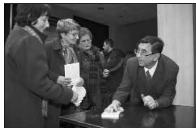
Szigeti testvér könyveit dedikálja az érdeklődők részére.