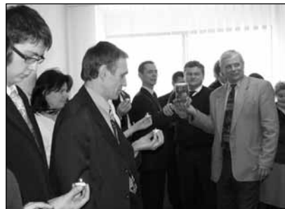
Az Aszódi Misszió tagjai továbbadták az evangélium üzenetének lángját

2008. február 23–24-én úgy ünnepeltük a szombatot Aszódon, ahogy talán kevesebben tesszük. Két mikrobusznyi, odaszentelt életű, ragyogó arcú testvér jött hozzánk Erdélyből azzal a céllal, hogy segítsek missziós törekvéseinket. Majd egy harmadik mikrobusz is érkezett Zala megyéből. Végül néhány isaszegi és gödöllői testvérünkkel kiegészülve összesen 55-en voltunk. Mindannyiunkat egy cél vezérelt: eleget tegyünk Krisztus misszióparancsának!