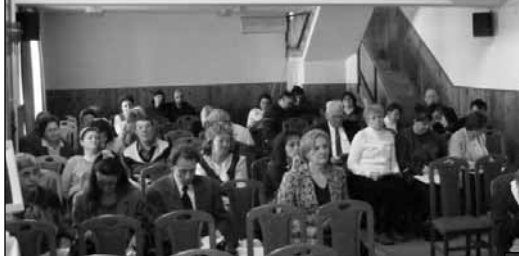
Az önkéntes találkozó résztvevői

A Budapest XVIII. kerületi Önkormányzattal történt megbeszélésünk alapján jótékonysági vásárt tartottunk a Kondor Béla Közösségi Házban. A rendezvényünket látogatásával megtisztelte Szaniszló Sándor alpolgármester úr és dr. Bucsi Anikó jogi referens, akinek az igazgatása