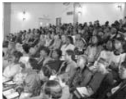
A küldöttek egy csoportja