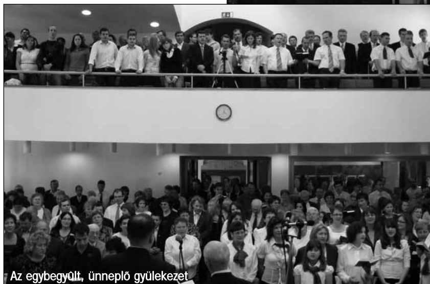
Az egybegyűlt, ünneplő gyülekezet

elnöke prédikációjában hallhattunk Jézus Krisztus áldozatának jelentőségéről. Hosszú listákat olvashattunk a Szentírásban arról, hogy kik azok, akik nem örökölhetik Isten országát. Valamelyik felsorolásban mindannyian megtalálhatjuk azokat a bűnöket, amelyek éppen a mi életünkben jelennek meg, vagy jelentek meg, és választanak el bennünket az örök élettől, ha Jézus meg nem mosott volna minket,