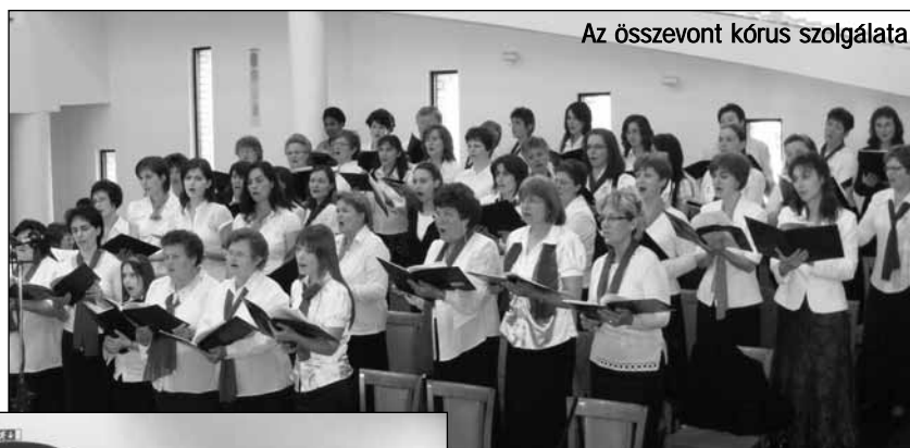
Az összevont kórus szolgálata