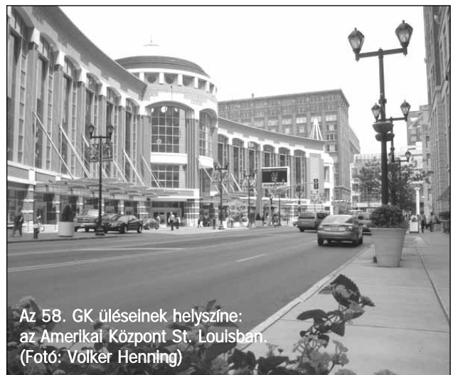
Az 58. GK üléseinek helyszíne: az Amerikai Központ St. Louisban.