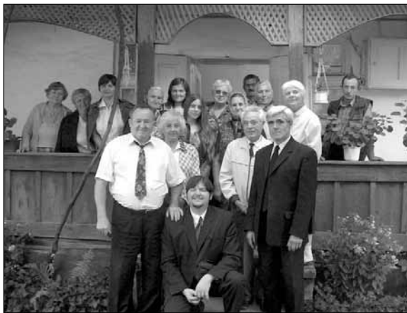
A nagyberégi imaház előtt. – Az ADRA az imaház szociális helyiségének beruházásában nyújt segítséget.

Örömmel számolunk be arról, hogy a lassan már egy éve működő Viski Étkeztetési