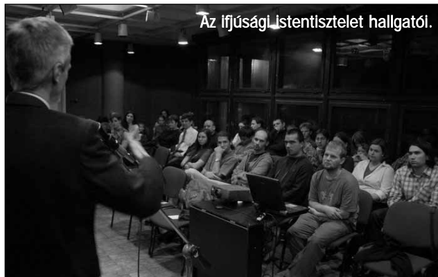
Az ifjúsági istentisztelet hallgatói.