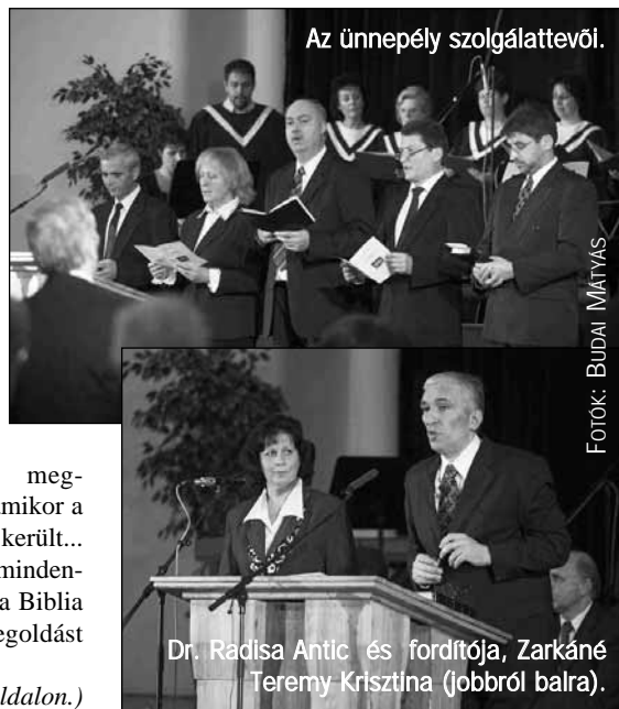
Az ünnepély szolgálattevői.