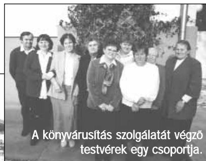
A könyvtárusítás szolgálatát végző testvérek egy csoportja.

gi és fizikai áldozatai segítségével sikerült felújítani a megvásárolt pavilont, amely 2005. (Folytatás a 8. oldalon.)