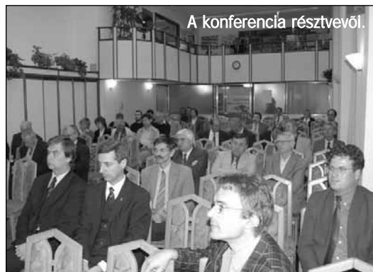
A konferencia résztvevői.

lelki és testvéri közösség kialakításáért. Egymás jobb megismerése és teljes tisztelettel való elfogadása teremti meg a lehetőségét a félreértések elkerülésének és a széles körű közös munkálkodásnak. Épp ezért egyértelmű támogatást nyert az a kezdeményezés, hogy az egyház közösségi jellegének erősítését szolgáló kommunikáció elősegítésére hozzunk létre Presbiteri Hírlevelet és internetes fórumot közös dolgaink rendszeresebb átbeszélésére. Itt hívjuk fel testvéreink figyelmét arra, hogy a hírlevél listára és a fórumba való jelentkezésre várjuk mindazokat, akik, ha nem is tudtak jelen lenni az országos összejövetelen, de gyülekezeti közösségük vezetői (presbíterek, gyülekezeti vezetők, tisztségviselők stb.). Aki jelentkezni szeretne az internetes fórumra, az küldjön egy mail-t a subscribe@presbiter.lx.hu címre, és ha a jelentkezéssel problémája van, akkor az owner@presbiter.lx.hu címre.