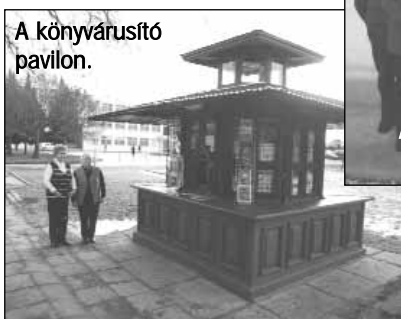
A könyvtárusító pavilon.

egyik lakónegyedének központjában. A testvérek kitartó imái, anya-