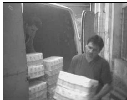
Az élelem kirakodása.

Szeretettel köszönjük adományaitokat, amit a magyarországi árvíz programra adtatok. A mintegy 150 E Ft lehetővé tette számunkra, hogy április legvégén két szállítmány élelmiszert vigyünk le a sokat próbált térségbe. Egy szállítmányt a Kunszentmártonra kitelepített (1500 fő) károsultak, egyet pedig a Csongrád térségében gátakon dolgozó önkéntesek kaptak. Ezúton köszönjük meg az AWW-Hungary Alapítvány adományát, az Univer Product RT. és a Budapesti Glóbusz Konzervgyár természetbeni adományát. Továbbá Szabó