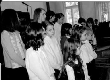
Anyák napi ünnepély.