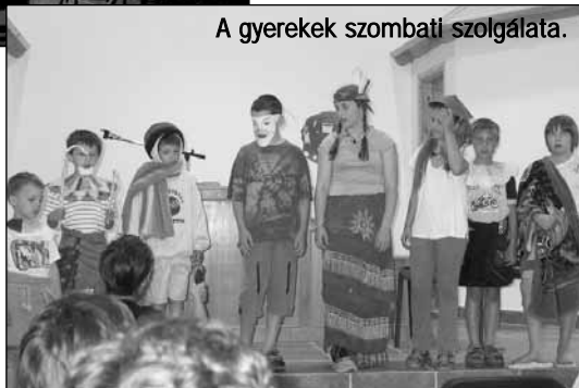
A gyerekek szombati szolgálata.

Egy másik hallgató az ország másik végében, Gyenesdiáson, mostanában végzett. Régóta felfigyeltem rá, milyen komolyan veszi a leckéket. Nagyon értékes, mély gondolatai és kérdései vannak a témával kapcsolatban. A napokban kaptam kézhez az utolsó levelét, és nem a dicsekvés hajt, hogy leírjam sorait, inkább azért teszem, hogy sokan, akik ebben a munkában fáradoznak, ők is kapjanak ebből az örömből, és erősödjének általa.