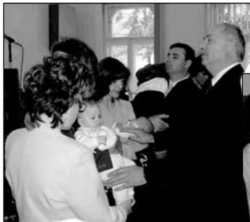
Gyermekekből kérés.