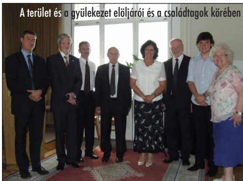
A terület és a gyülekezet elöljárói és a családtagok körében