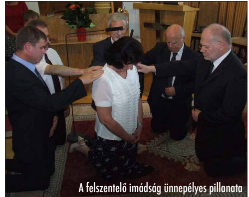
A felszentelő imádság ünnepélyes pillanata