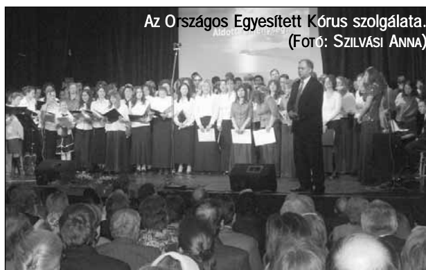
Az Országos Egyesített Kórus szolgálata.