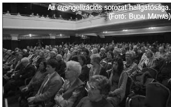
Az evangelizációs sorozat hallgatósága.