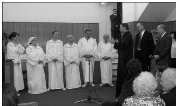
A Filey-program „első zsenégként” hat keresztelendő között szövetséget Krisztussal.