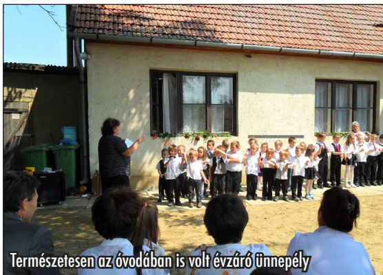
Természetesen az óvodában is volt évzáró ünnepély

Iskolánk az év folyamán több pályázatot is nyert, melyeknek eredményeképpen a gyerekek ingyen mehetek uszodába, színházba, bábszínházba, kirándulni és táborozni. De több oktatási eszközt is