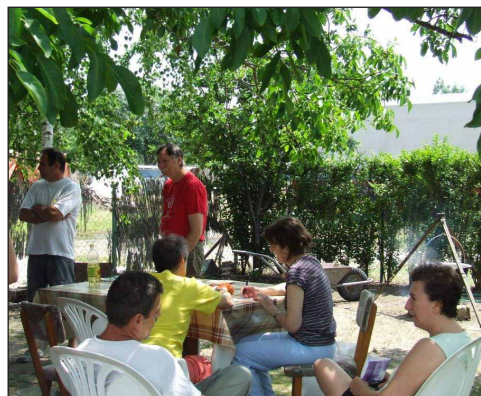
Eszmecsere az árnyas fák lombja hűvöseiben