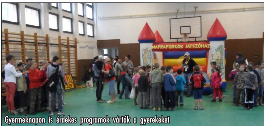
Gyermeknapon is érdekes programok várták a gyerekeket