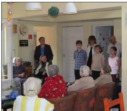
Az ifjak szolgálatukkal örvendeztették meg az otthon lakóit