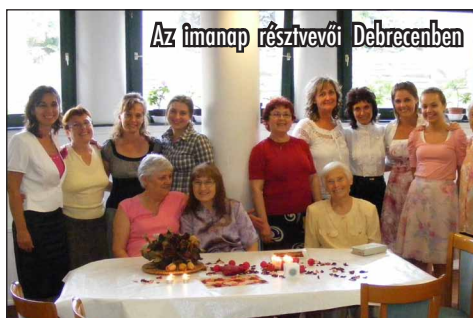
Az imanap résztvevői Debrecenben