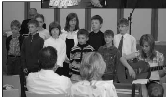
Fent: Áldáskérés – a lelkész-szentelés ünnepélyes pillanata