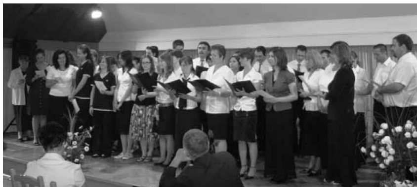
Az összevont kórus szolgálata