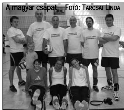
A magyar csapat.