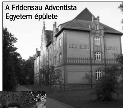
A Fridensau Adventista Egyetem épülete

Ezen kívül a missziókonferencia egyik főszervezőjeként dolgozom. Krisztusközpontú, motiváló, a tagságot konkrét szolgálatokra is felkészítő konferenciát tervezünk. Célunk még az is, hogy az egységért dolgozzunk, hogy a különböző generációk egymáshoz közelebb kerüljenek, hogy fiatal és idős is felfedezze, mindannyian egy család vagyunk. Nagy