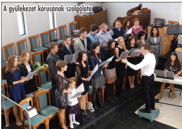
A gyülekezet kórusának szolgálata