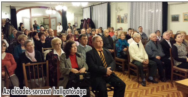
Az előadás-sorozat hallgatósága

A zsúfolásig megtelt békéscsabai Ipartestület Székházának előadótermében a fiatal generáció olykor állva hallgatta végig a tudományos érdekességekkel színesített beszédét.