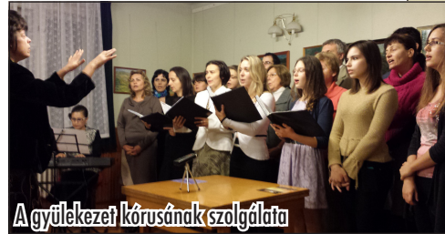
A gyülekezet kórusának szolgálata

A mai Magyarország első adventista gyülekezetét Békéscsabán alapították,