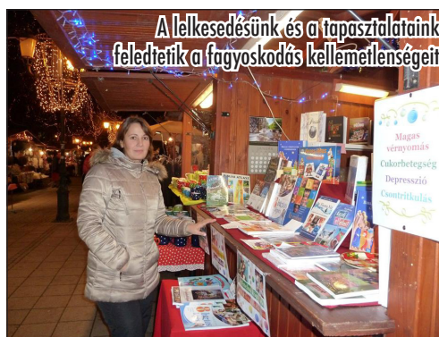
A lelkesedésünk és a tapasztalataink feleltek a fagyoskodás kellemetlenségeit