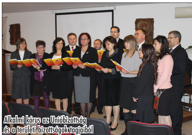
Alkalmi kórus az Unióbizottság és a területi bizottságok tagjaiból

A hétvége célja volt, hogy az egyház szolgáltatásainak lehetőségeiről és kihívásairól tanácskozzunk és meghatározzuk a Magyar Unió következő öt évének stratégiai céljait. Az előkészítő munkálatok már hónapokkal korábban elkezdődtek, amikor az Unióbizottság tagjai megismerhették a Generál Konferencia célkitűzéseit. Az intézményvezetők és osztályvezetők előre megkapták a feladatot, hogy tekintsék át a felelősségi területüket, határozzanak meg célokat, hangsúlyos területeket a szolgáltatáson belül, fogalmazzák meg, milyennek szeretnék látni az általuk vezetett területet. A lelkészeket is bevontuk a feladatba: egyrészt egy SWOT analízis keretében megfogalmazták, hogyan látják az egyház jelenlegi helyzetét, milyen erősségeket, gyengeségeket, lehetőségeket és veszélyeket látnak az egyház életében.