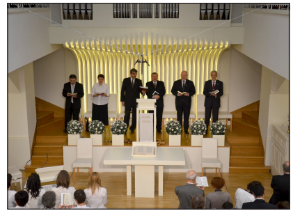
Jobbra: Az ünnepi istentisztelet szolgáltatói

üdvözlő szavakkal méltóképpen megemlékeztünk gyülekezetünk múltjáról, miközben előre tekintettünk örök célunk felé.