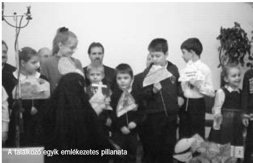
A találkozó egyik emlékezetes pillanata