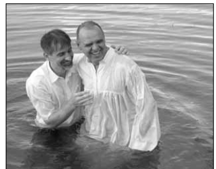
Az új élet öröme Krisztusban.