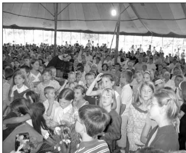
Pillanatkép a konferencia résztvevőinek egy csoportjáról a szombat délelőtti gyermekprogram alkalmával.

– Az elmúlt években is látogatója voltam a rendezvénynek, de a gyermekünk születése miatt tavaly csak hétvégére