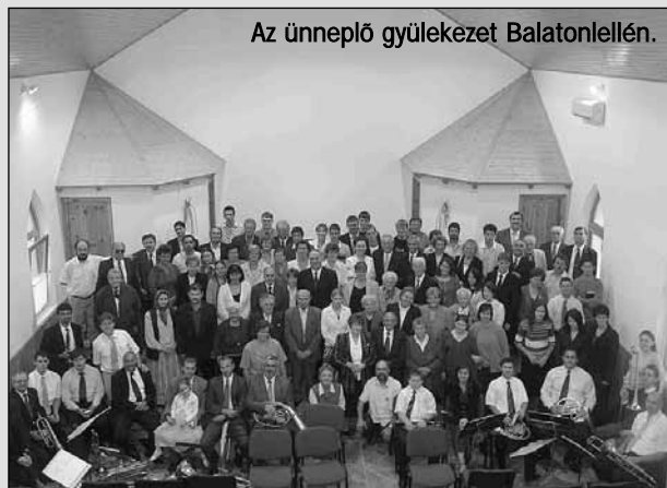
Az ünneplő gyülekezet Balatonlellén.

közösség, mely befolyással bír a társadalomra”.