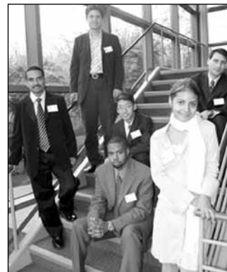
A Generál Konferencia Végrehajtó Bizottságának új, ifjú tagjai.

lított felsőoktatással kapcsolatos szakbizottság végső jelentését, és megszavazta az oktatási intézmények fejlesztésére vonatkozó ajánlásait.