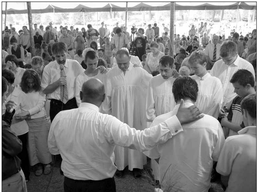
A keresztelendőkért mondott imádság alkalmával „Stephen McKenzie megtérési felhívására további 80 ember döntött Krisztus mellett...”

Isten ezen a konferencián számomra is különleges ajándékot tartogatott. Eddig az évig rajtam volt a konferencia szervezésének fő felelőssége, ami rengeteg munkával és felelősséggel járt. Az Úr azonban bőségesen kárpótolt minden fáradságért, hisz az idén saját apósomat keresztelhettem meg Baján. Több mint egy évtizede imádkoztunk már a meg-