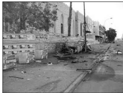
A képen a felrobbant kocsit látható a gyülekezet keleti oldalánál.