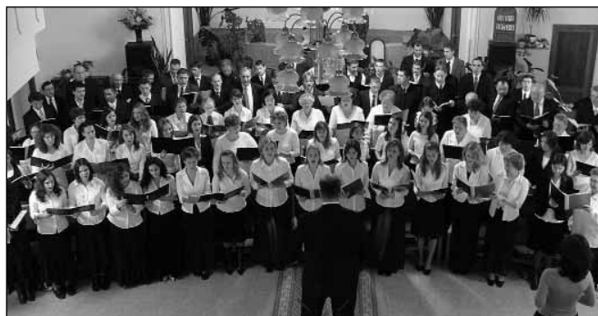
Az összevont kórus szolgálata a békéscsabai kápolnában.