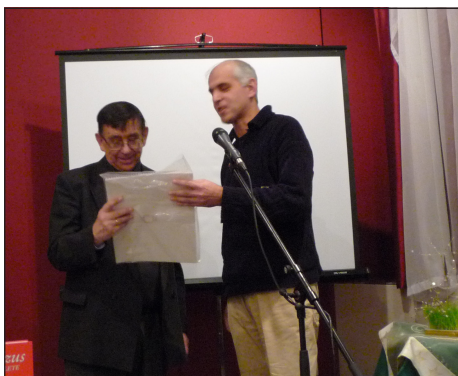
76. születésnapja alkalmából felköszöntöttük Szigeti testvért, aki a 23 év alatt már 160 előadást tartott Kecskeméten