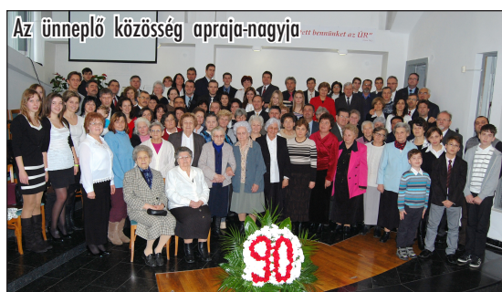
Az ünnepelő közösség apraja-nagyja

Szemünk gyakran lábadt könnybe, amint visszatekintettünk az elmúlt 90 esztendőre. A fájdalom, öröm és hála érzése mind-mind jelen volt ezen az ünnepségen. A múltat szemlélve bizalommal tekintünk a jövőbe. A Szentírás szavait mi is csak ismételni tudjuk: „...Mindaddig megsegített az Úr!” (1Sám 7:12).