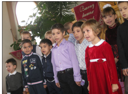
A legkisebbek szolgálata