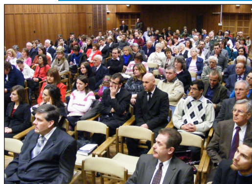
Lent: A képzés résztvevői