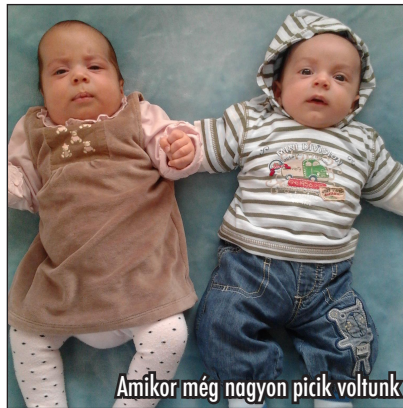
Amikor még nagyon picik voltunk