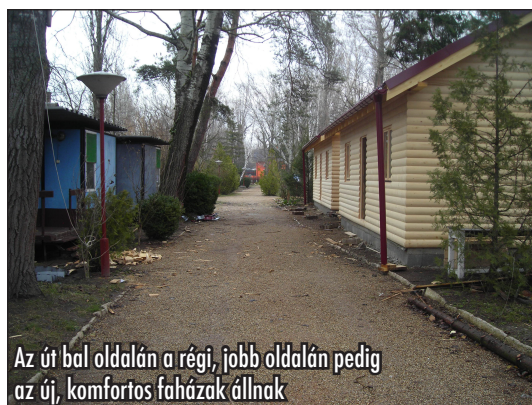
Az út bal oldalán a régi, jobb oldalán pedig az új, komfortos faházak állnak

A tavalyi évben az unióelnökség keresve a pályázati lehetőségeket, Balatonlellel kapcsolatban is nyújtott be néhány pályázatot. Az egyik pályázat nyert, így épülhetett meg az a két új faház, amely jelenleg a Konferenciái Központ legmagasabb komfortfokozatú helye. A faház felépítéséhez nem elegendő a pályázati összeg, még hozzá kell tenni. Szeretnénk,