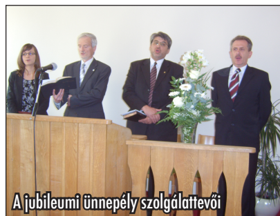
A jubileumi ünnepély szolgáltatói

A szombati nappal azonban nem ért véget a program, másnap egy közös kirán-