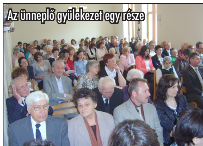
Az ünnepelő gyülekezet egy része

Meghívtuk azokat a régi tagokat, akik elköltöztek és más gyülekezetbe járnak, de