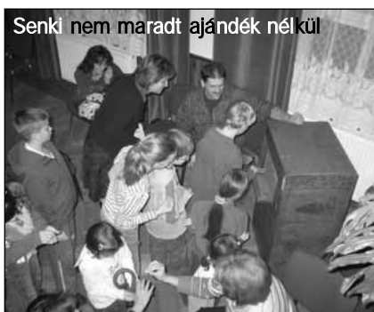
Senki nem maradt ajándék nélkül