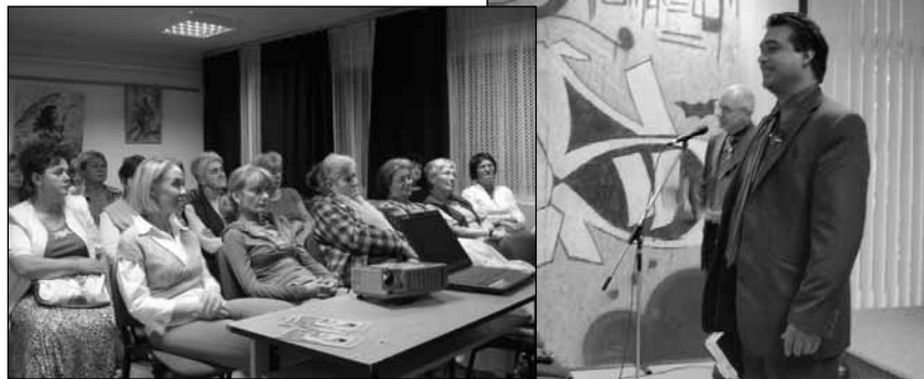
Balra: A pásztói előadás-sorozat hallgatói