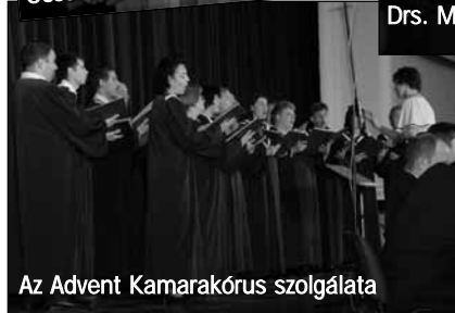
Az Advent Kamarakórus szolgálata