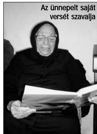
Az ünnepelt saját versét szavalja

A gondosan kiválogatott vers- és ének-zenei szolgálatok emlékeztetést tettek e szombatnapot, melyen a bojtó testvérek is megörvendeztettek bennünket önálló programjukkal. Bárcsak több ilyen