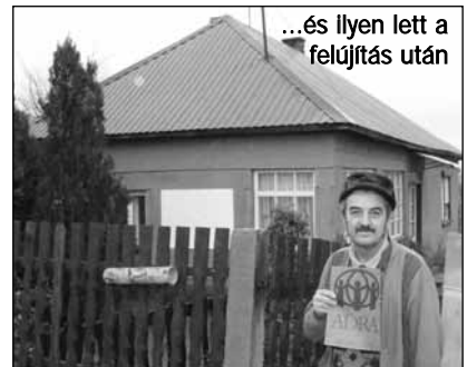
...és ilyen lett a felújítás után