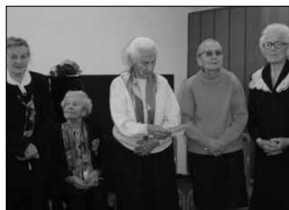
Lent: A Terézvárosi Gyülekezet 90 éven felüli ünnepeltjeinek körében