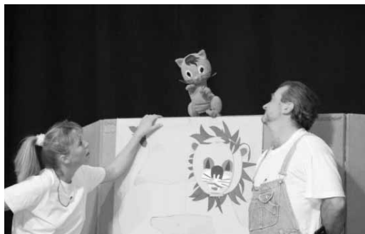
A bábegyüttes tanulságos programja a gyerekek kikapcsolódását és nevelését szolgálta.

A sok-sok támogató által (Hotel Napsugár, Transzeurópai Divízió, Dunamelléki Egyháztérület, GYIK, helyi vállalkozók és magánemberek) megvalósuló rendezvény több részből állt. Elsőként profi bábosok (Marcipán cica) várták a gyermekeket. Műsoruk a természetéről, barátságáról és családi szeretetről, összetartozásról szólt. A továbbiakban a hetekkel előtte meghirdetett „Jézus a Bibliában” című rajzpályázat elbírálására is sor került.