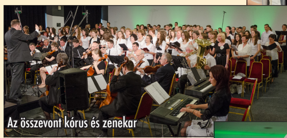
Az összevont kórus és zenekar