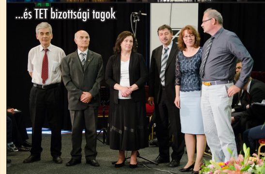
...és TET bizottsági tagok