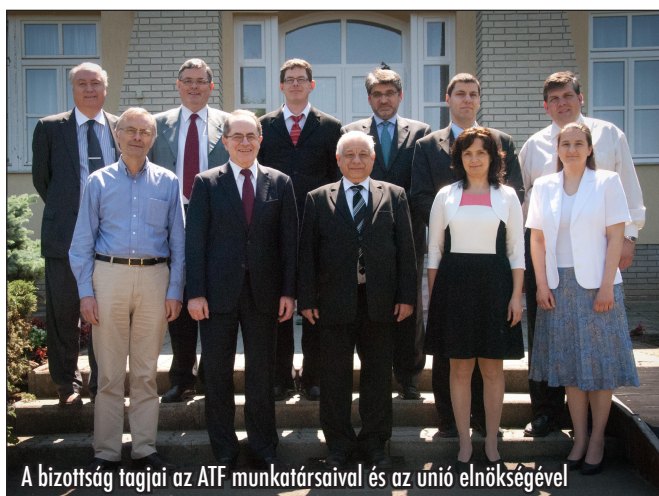
A bizottság tagjai az ATF munkatársaival és az unió elnökségével