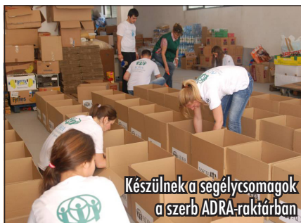
Készülnek a segélycsomagok a szerb ADRA-raktárban