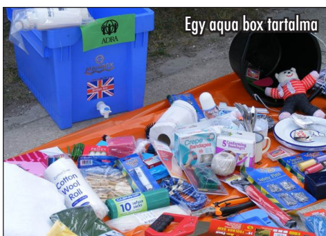
Egy aqua box tartalma