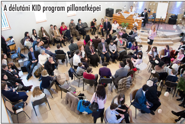
A délutáni KID program pillanatképei