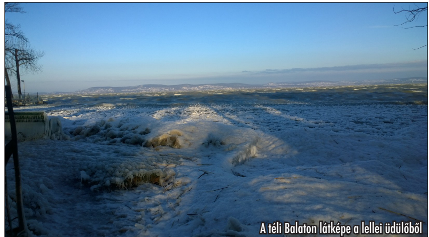
A téli Balaton látképe a llelei üdülóból

Már most keressük a nyári nyitva tartás idejére a dolgozókat, így várjuk azok jelentkezését, akik szívesen dolgoznának az Adventista Konferenciaközpontban az alábbi munkakörök valamelyikében: szakács, konyhai kisegítő, takarító, kar-