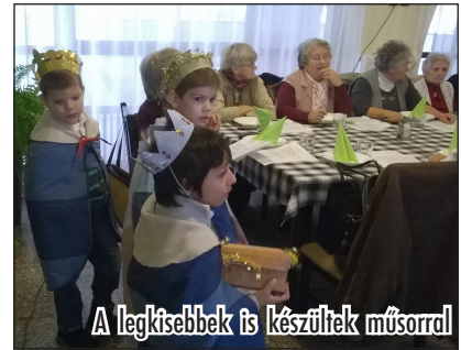
A legkisebbek is készültek műsorral

Szívből kívánom, hogy továbbra is igazi baráti kapcsolatok születhessenek az itteni emberek