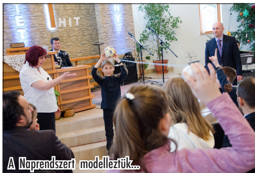
A Naprendszeri modelleztük...