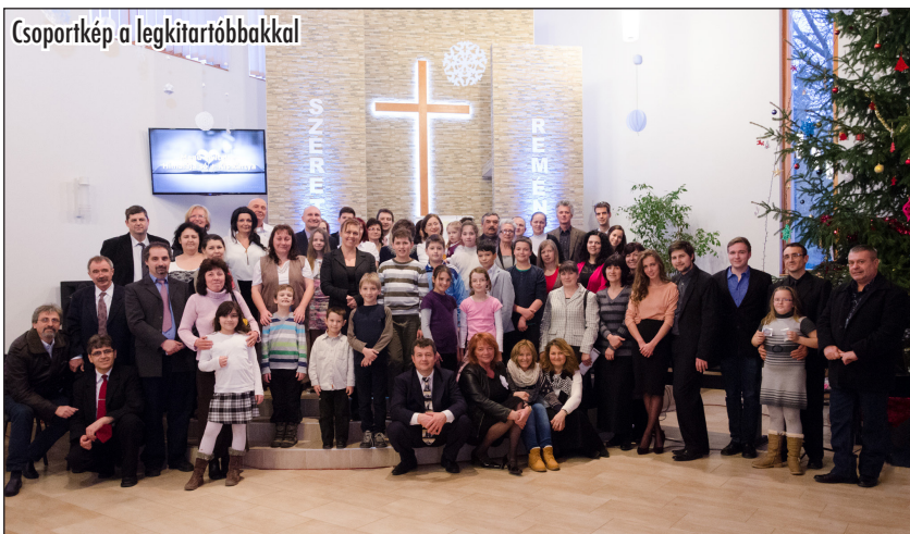
Csoportkép a legkitartóbbakkal