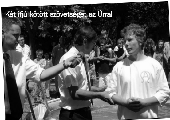
Két ifjú kötött szövetséget az Úrral

Az egyház nyári programjainak csúcspontját ebben az évben is a missziókonferencia jelentette, amelyet az unió ezúttal Szegeden rendezett meg. A konferenciát a város szívében lévő Erzsébet Ligetben tartottuk, ezzel is kifejezve, hogy a missziókonferencia nem csupán egy misszióról szóló rendezvény, hanem egy olyan alkalom, amikor a missziót élőben is gyakoroljuk.