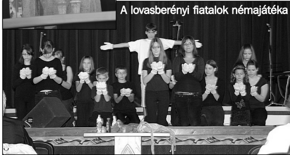
A lovasberényi fiatalok némajátéka