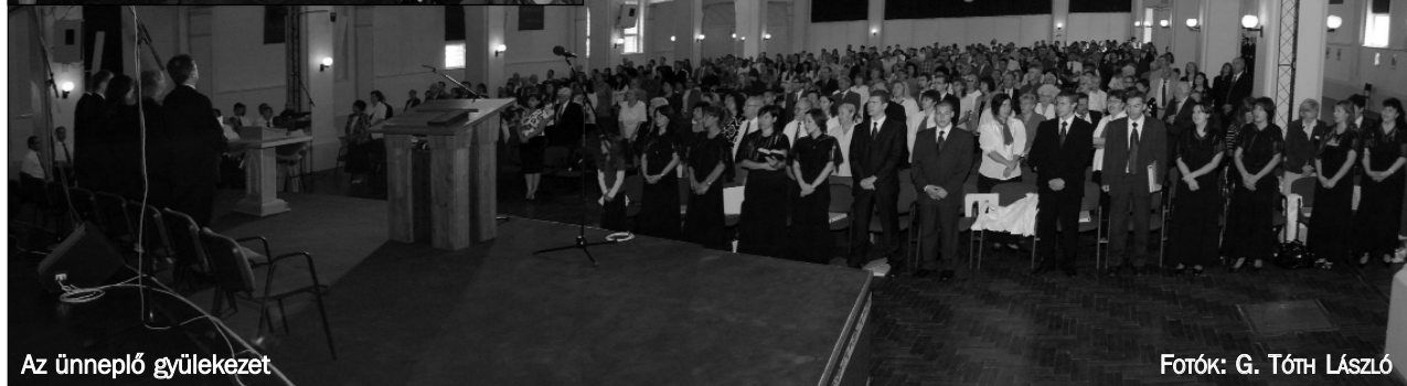
Az ünneplő gyülekezet