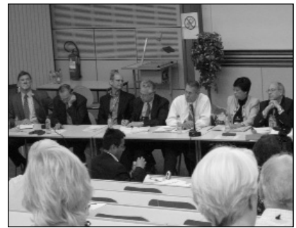
A résztvevők jeles egészségügyi szakemberek előadásait hallgathatták meg