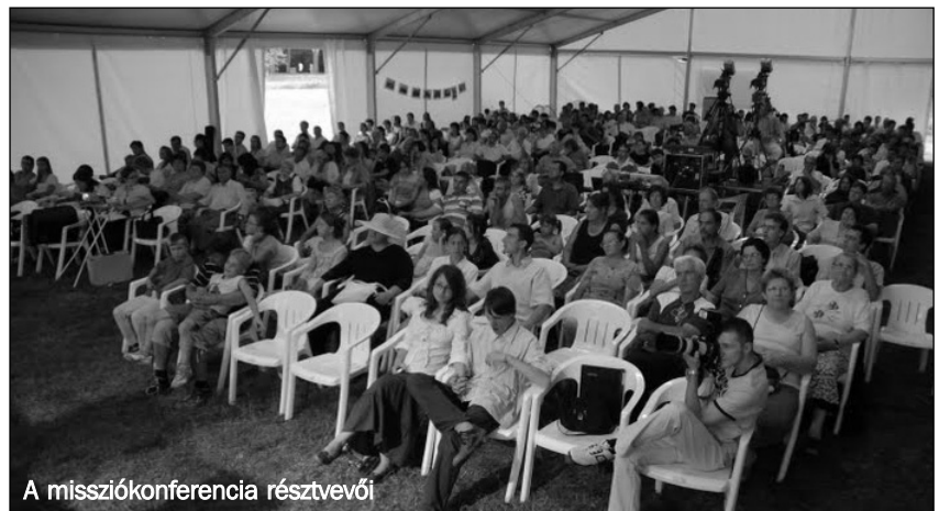
A missziókonferencia résztvevői