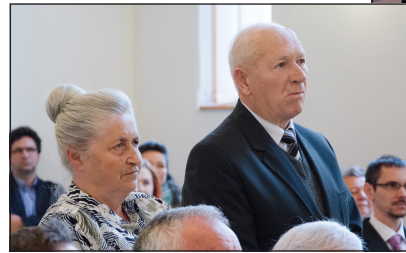
A hitvallással (fent) és a levéllel (balra) felvett új testvéreink

a felső tagozatos gyermekektől a nyugdíjasokig mindenkinek helye van benne, akik rendelkeznek az éneklés kegyelmi ajándékával.