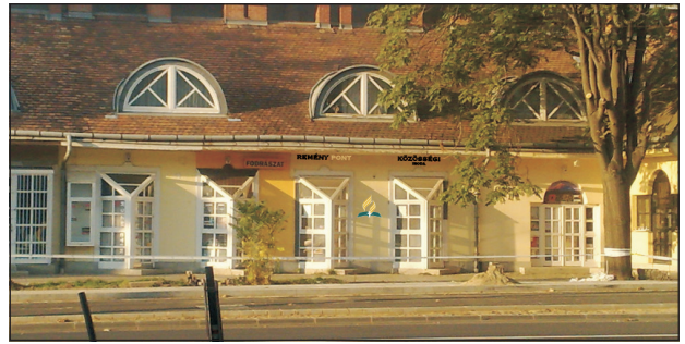
A Debrecen belvárosában hamarosan megnyíló ReményPont Közösségi Iroda épületének homlokzati látványterve

A befolyási központban megvásárolhatók az Advent Kiadó által kiadott könyvek, ugyanakkor az AK jóváhagyásával más keresztény kiadókkal is felvettük a kapcsolatot árusítás céljából.