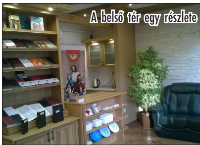
A belső tér egy részlete

...és imádkozzatok érte az Úrhoz, hiszen jóléte a ti jóléteket is” (Jer 29:7). Jeremiás próféta könyvét tanulmányozva sokat mond nekem ez az igeszakasz, mert amire Isten a próféta által hív bennünket, éppen ezt tervezük és álmódjuk a Debrecenben hamarosan megnyíló Darabos utcai ReményPont Közösségi Irodában. Hogy mit lehet még erről a kb. 30 négyzetméternyi helyiségről tudni? Kiléptünk a gyülekezetből és beköltöztünk a város központjába, a Pláza bevásárlóközpont szomszédságába, ahol 5 percenként jár a kettős villamos és tömegnyí ember fordul meg.