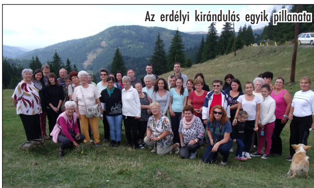
Az erdélyi kirándulás egyik pillanata