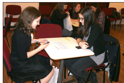
Csapatversenyzők várnak a kezdésre