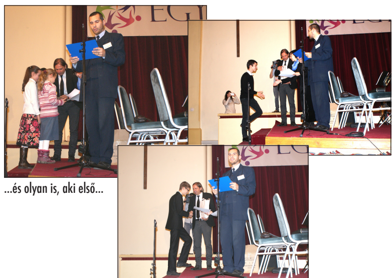
...és olyan is, aki első...

Megerőte? IGEN. Tehát lesz folytatás! Jövőre Mózes 2. könyvével kezdünk. Hamarosan elindítjuk a regisztrációt. Addig is a http://det.adventista.hu/2015-esemenyei/bibliai-olimpia/ oldalon megtalálhatjátok az általatok megfogalmazott véleményeket teljes terjedelemben, nézegethettek fényképeket, olvashatjátok a bakikat.