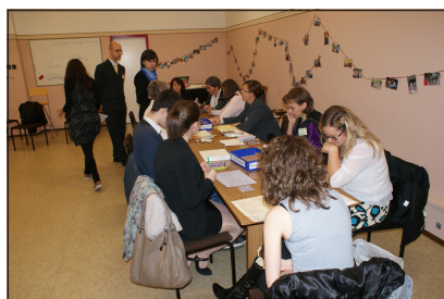
A javító csapat