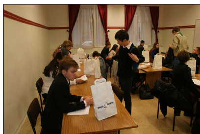
Kezdsére várva az egyéni versenyzők termében