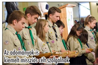
Az adományok is kiemelt missziós célt szolgálnak

A Bibliai Olimpia utolsó fordulójának befejezése és az eredmények összeszámolása után az eredményhirdetésre is