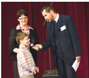
Az egyházközség missziós programjait is a fiatalok közreműködésével mutatta be