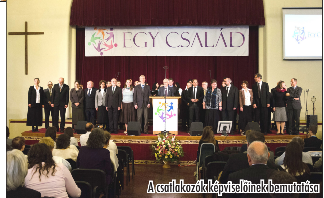
A csatlakozók képviselőinek bemutatása

A délelőtti adakozás a Reformációs Év missziós könyvének kiadását szolgálta. Közel 1 millió Ft gyűlt össze a helyszínen, ami segíteni fogja a „Jelenések könyvének 7 reformációs üzenete” című kiadvány nagy példányszámú kiadását. A reformáció 500 éves évfordulójához további missziós események is kapcsolódnak majd.