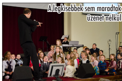
A legkisebbek sem maradtak üzenet nélkül

Egyrészt a Bibliai Olimpia utolsó fordulója, másrészt az ADRA szervezésében, a főtí Károlyi István Gyermekközpont javára tartott jótékonyági hangverseny zajlott egy időben. A koncerten a délelőtt már hallott kórusok adták elő újabb szolgálataikat, és bemutatásra került a támogatott gyermekotthon is. Az adománygyűjtés alkalmával vendégeink több, mint 800 000 Ft-ot gyűjtöttek össze a felnőtt kísérő nélkül hazánkba érkezett menekült gyermekek javára.