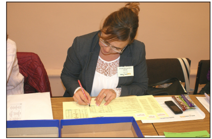
Gyorsan megy a javítás