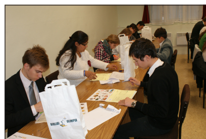
Nem is olyan sok a 10 feladat!