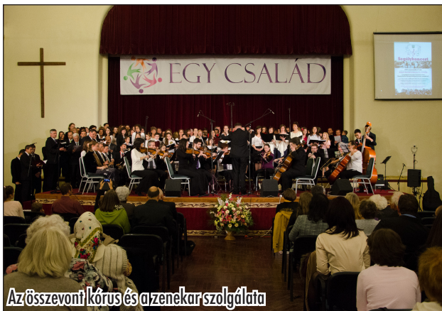
Az összevont kórus és a zenekar szolgálata

Az ADRA az elmúlt időszakban felvette a kapcsolatot az intézménnyel, segélyrút is vittünk támogatottjaink részükre. Főten, 2015-ben több mint 2300 gyermeket fogadtak be. Jelenleg mintegy 110 kiskorú él ott, aki vagy szeretne hazánkban letelepedni, vagy más országok felé tart.