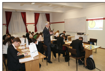
Majdnem 58 perc van még hátra az egy órából