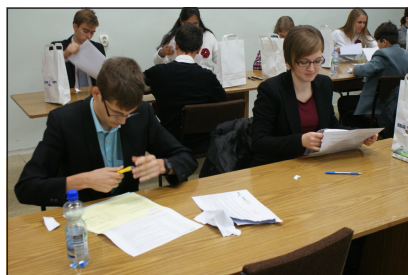
Végre kibonthatjuk a borítékot!