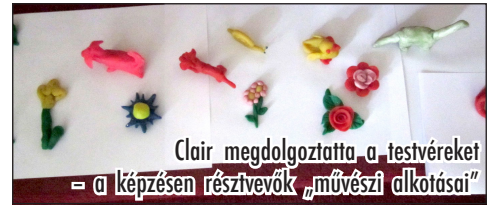
Clair megdolgoztatta a testvéreket a képzésen résztvevők „művészi alkotásai”