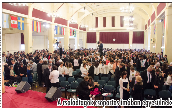
A családtagok csoportos imában egyesülnek

Bár az egész program ünnepélyes volt, egy momentum külön kiemelendő a sok közül. Míg a család régi és új tagjai a sorok között ültek, a nagy család képviselői az emelvényről pecsételték meg a rég várt találkozást. Semmihez sem fogható, negyven éve várt élmény, és egy ima, amikor a régi és az új testvérek több, mint 1100-an együtt imádkoztak az egységért. Ezzel zárult a folyamat, mely már hosszú ideje tart, és indult el egy új, ami reméljük, sokkal hosszabb ideig fog tartani. A csatlakozó testvéreink, a család új tagjai képviselőiben színpadra hívták a hét új lelkészt, akik szolgálataikat a Dunamelléki Egyházterületen fogják végezni, mögöttük az őket támogató „rég” lelkészekkel, majd a második sorban annak a hét csatlakozó gyü-