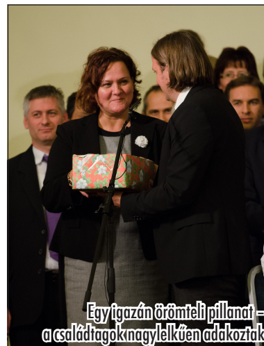
Egy igazán örömteli pillanat a családtagok nagy lelkesen adakoztak