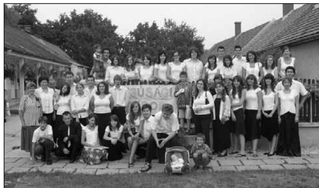
Az Országos Ifjúsági és Zenei Tábor résztvevői.

A lovasberényi táborokhoz kapcsolódó elménybeszámolókat egyházunk hivatalos honlapján olvashatóak: www.adventista.hu