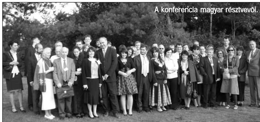
A konferencia magyar résztvevői.

Az első este az egyházon belüli különbözőségek elismeréséről és megértéséről szóltak a szakmai előadások. Az egyházon belüli különbözőségeknek nemcsak hagyományos (nyelvi, kulturális, formai, istentiszteleti formákból adódó), hanem teológiai okai is vannak. Míg az előbbieknél szükségse-