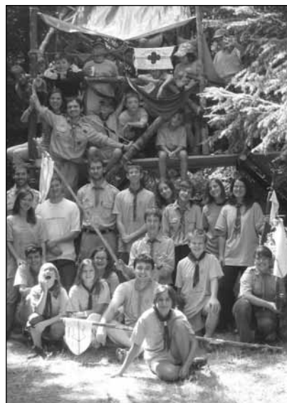
A kéteemeletes táborkapu a táborlakkal

További fotók és írások a www.negylevelufa.extra.hu honlapon!