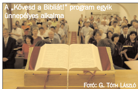
A „Kövessd a Bibliát!” program egyik ünnepélyes alkalmá

Ezért pedig mindenképpen hálásak vagyunk. Hálásak vagyunk Istennek, hogy adott lehetőséget az evangelizációra. Az egyházterületek koordinálásával, támogatásával a gyülekezetek szervezésében testvéreink lelkesen vettek részt a szolgálatban.