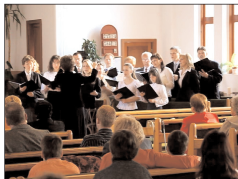
A Békéscsabai Gyülekezet újrászerveződött kórusának szolgálata

Az ünnepélyre meghívtuk a folyamatban lévő evangelizációs sorozat hallgatóit is, akik közül nagyon sokan elfogadták a meghívást. A húsvéti megemlékezést állófogadás követte, ahol tea és pogácsa mellett további lehetőség nyílt a vendégekkel való beszélgetésre, barátkozásra. Az ünnepély hangulata nagyon bensőséges volt, amit egyik vendégünk véleménye is jól tükröz: „bensőséges,