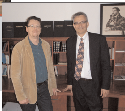
Jobbra: Goldstein testvér Pecsuk Ottó, a Magyar Bibliatársulat elnökének társaságában (jobbról balra)

A Magyar Unió Szombatiskolai Osztálya és a Budapest-Terézvárosi Gyülekezet meghívására 2010. április 6. és 12. között hazánkban tartózkodott Clifford Goldstein testvér, a Generál Konferencia Szombatiskolai Osztályának főszerkesztője, aki 1999 óta szerkeszti a Bibliatankönyveket.