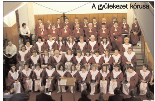
A gyülekezet kórusa