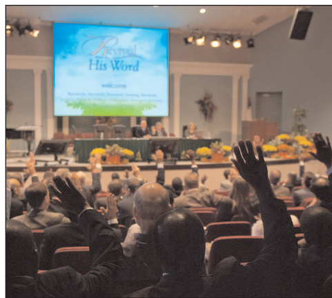
A területi átszervezés javaslata túlnyomó többségű szavazatot kapott

A Közel-Keleti Unió területéből kizárólag Ciprus görögök lakta területe marad a TED-nél.