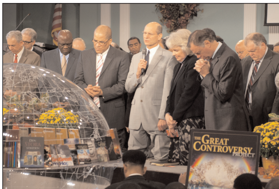
Az egyház vezetői imában Isten áldását kéri a Nagy küzdelem programra