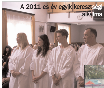
A 2011-es év egyik keresztségi alkalma

➤ Megszervezésre került a Péceli Gyülekezet, ahova azóta több családot küldött a Szentlélek, akik a közösséghez szeretnének tartozni.