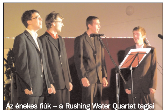
Az énekes fiúk – a Rushing Water Quartet tagjai