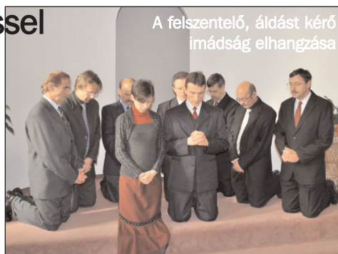
A felszentelő, áldást kérő imádság elhangzása