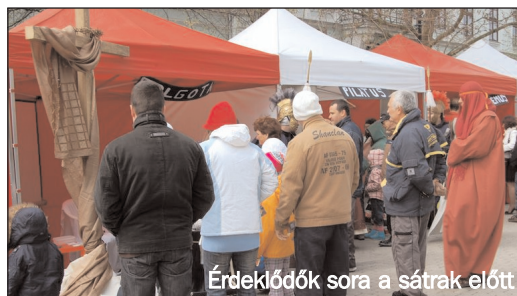
Érdeklődők sora a sátrak előtt

A második sátnál azt a történetet mondta el János tanítvány, amelyben Jézus megvendégelte a sokaságot. Pogácsával, szárított hallal és meleg teával próbálták a tanítványok ezt feleleveníteni. Jézus figyel fizikai szükségleteinkre.