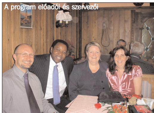
A program előadói és szervezői