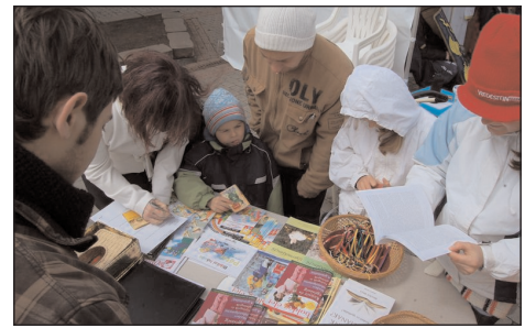
Hamar elkeltek az ajándékok is

Köszönettel tartozunk a résztvevőknek: annak a 8 gyülekezetből (Hajdúhadházi, Nyírbogdányi, Nyíregyházi, Nyírmeggyesi, Nyírpazo-