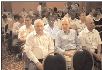
A konferencia résztvevőinek egy csoportja

2012. június 11-én kezdődött és 21-én ért véget a Harmadik Nemzetközi Bibliai Konferencia, amit a Generál Konferencia finanszírozott és a Bibliai Kutatóintézet munkatársai szerveztek. A háromszázhatvan meghívott között voltak generál konferenciái, valamint divízió főtisztviselők, lelkesítő és nevelési osztályvezetők, lapszerkesztők, de legnagyobb létszámban teológiai tanárok, tanszékvezetők, valamint olyan egyetemi és főiskolai vezetők, akik a teológiai képzés területén dolgoznak. A konferencia jelentőségét mutatja,