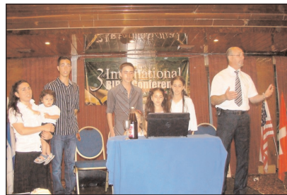
Egy helyi zsidó rabbiból adventista lelkesítő lett atyafi és családja szolgál a konferencián. Bemutatják a szombat befejezésének a módját

Tizenhárom előadás és ötvenhat csoportos megbeszélés dolgozta fel a téma